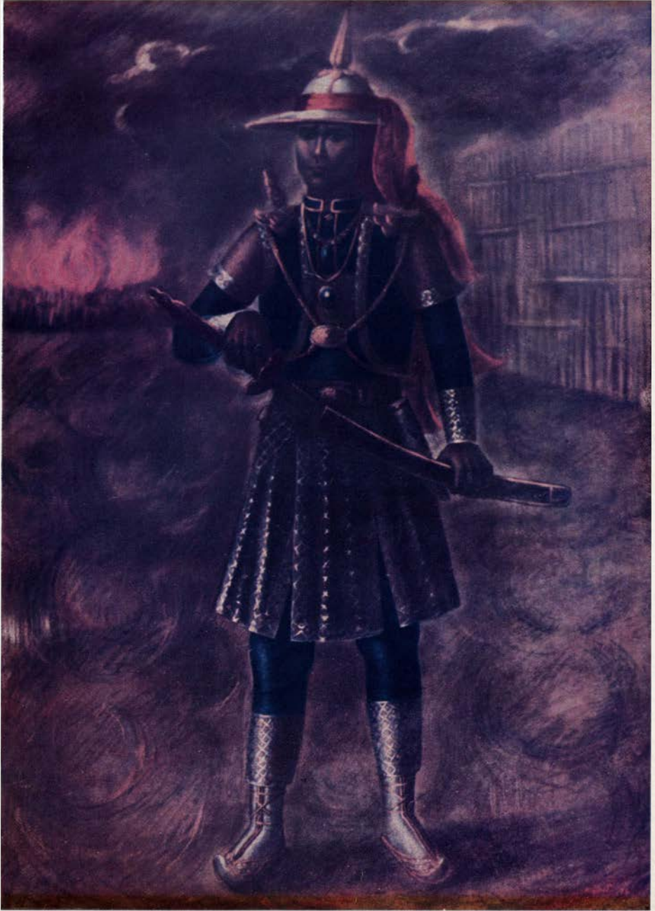
สมเด็จพระนเรศวรมหาราช ฉลองพระองค์ในวันทรงกระทำยุทธหัตถี